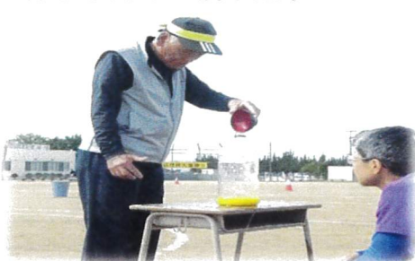
一杯ならんの～満水競争