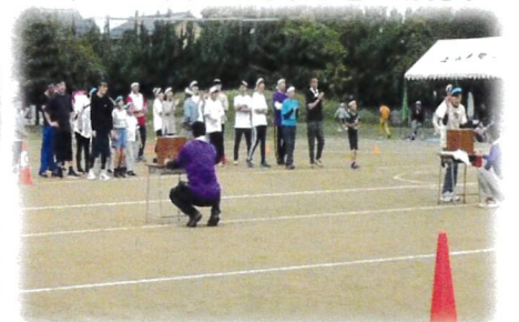
くじ運頼みの出たところ勝負