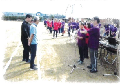
緑団（上小泉）の優勝です