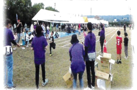
100m走で競技スタート