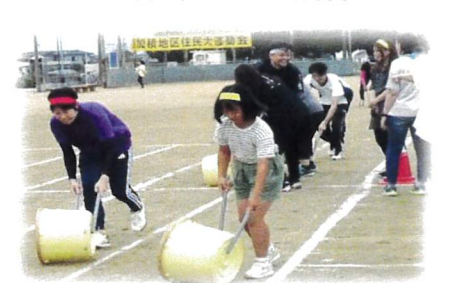
どこに行くがけ？酒樽リレー