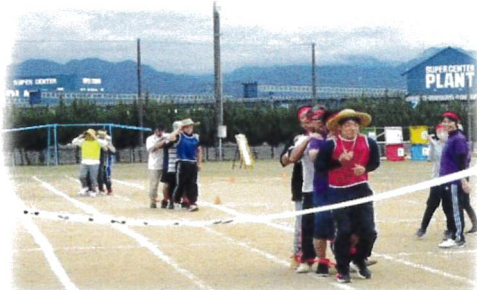
みんなで掛け声合わせ百足競争