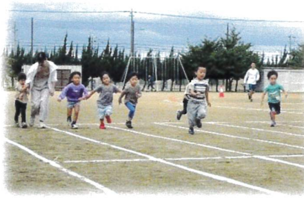
かけっこ。がんばれ～