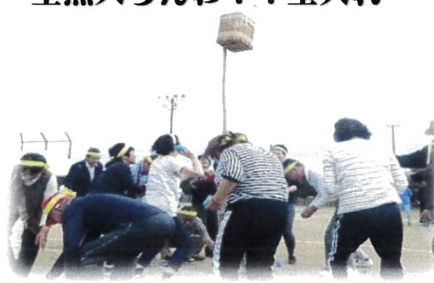
全然入らんわ！！玉入れ