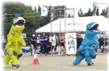
新種目の恐竜レース