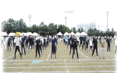
ラジオ体操で準備万端